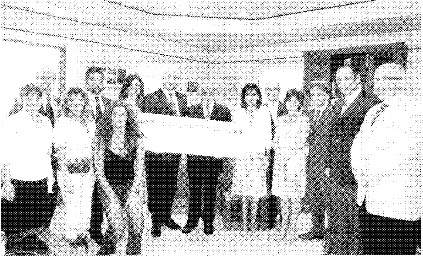
تقديم التبرع الى رئيس الجامعة اللبنانية - الاميركية

أجل ذلك انما فيه تجسيد عملي لمدي التزامكم بهذه الجامعة التي نضخر كلنا بالانتماء اليها، والتي تقوم بمسؤولياتها انطلاقاً من تحسس عميق كامن لدى كل واحد منا بأن هناك واجبا علينا تجاه مجتمع هذا الوطن ومجتمعات المنطقة العربية".